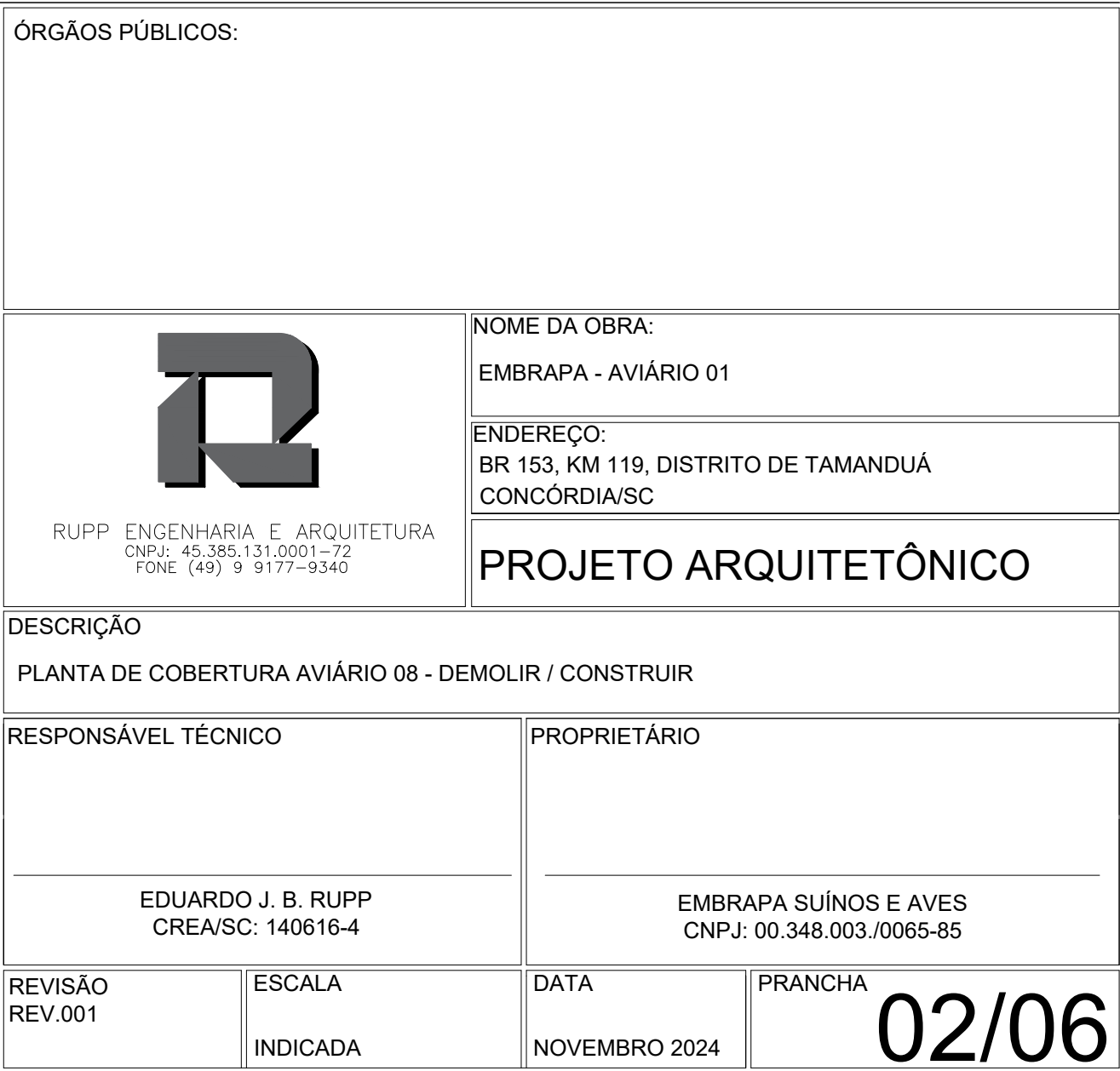
PLANTA DE COBERTURA AVIÁRIO 08 – CONSTRUIR ESCALA.: 1/75

EXISTENTE/MAIOR CONSTRUIR/SUBSTITUIR COBERTURA EM ALUMINÓ-AMMA